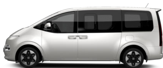
Shimmering Silver Metallic