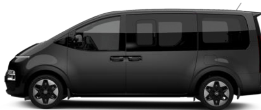
Abyss Black Pearl