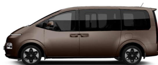
Gaia Brown Pearl nur für Bus verfügbar