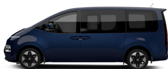
Moonlight Blue Pearl