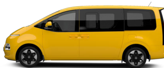
Dynamic Yellow nur für Transporter verfügbar