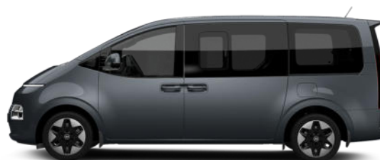
Graphite Gray Metallic