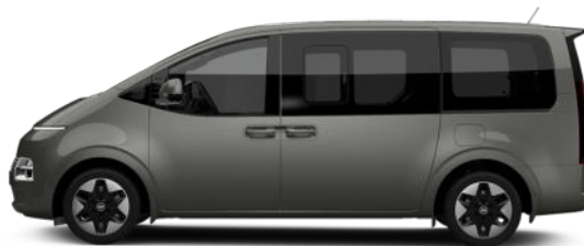
Olivine Gray Metallic nur für Bus verfügbar