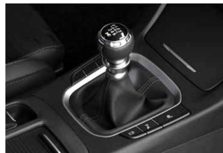
N-Line Lederschaltknauf mit Chromumrandung und N Logo