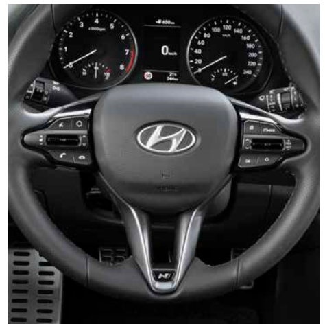
N-Line Sportlenkrad mit N Logo