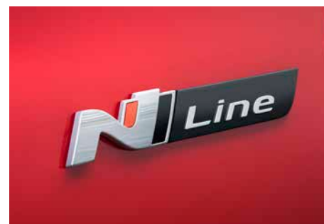
N-Line Emblem auf den vorderen Kotflügeln

Mit den neuen Ausstattungslinien N-Line und N-Line Plus erhält der Hyundai i30 5-Türer echte Rennsportgene: Sportliche Designelemente im Stil unseres erfolgreichen Hochleistungsfahrzeugs i30 N sowie eine Extraportion Dynamik bei Bremsen, Reifen und Fahrwerk. So wird jede Alltagsfahrt zum besonderen Erlebnis.