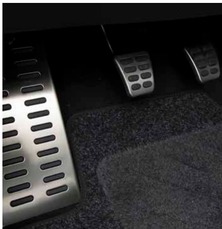
Sportpedale in Aluminiumoptik