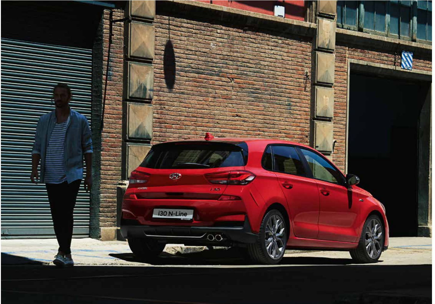
Heckschürze mit integriertem Diffusor und silberner Zierleiste

Eine Fülle exklusiver Designdetails lässt an den N-Genen dieses Hyundai i30 keine Zweifel: Neben der markanten Front- und Heckschürze, runden Applikationen mit dem N Logo auf dem Sportlenkrad und dem Schaltknäuf im Innenraum sowie die Sportsitze aus dem i30 N das Paket ab. Für ein dynamisches Fahrverhalten sorgen ein optimiertes Fahrwerk inklusive größere Bremsanlage vorne. Daher steht der i30 N-Line und N-Line Plus für noch mehr Agilität und Fahrspaß!