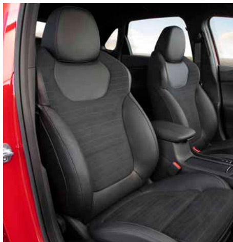
N-Line Plus Sportsitze Veloursleder/Leder 6)