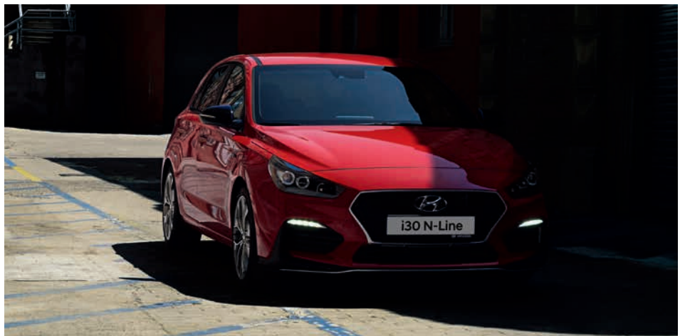
Frontlippe in Schwarz mit silberner Zierleiste